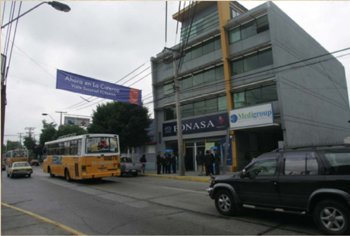
Para estar más próximos a los usuarios se crea una red de sucursales en toda la Región Metropolitana. En la imagen, comuna de La Cisterna, 2005.