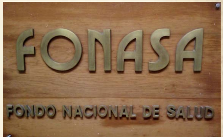
Primeros letreros corporativos instalados en las cinco direcciones regionales de Fonasa, 1993..