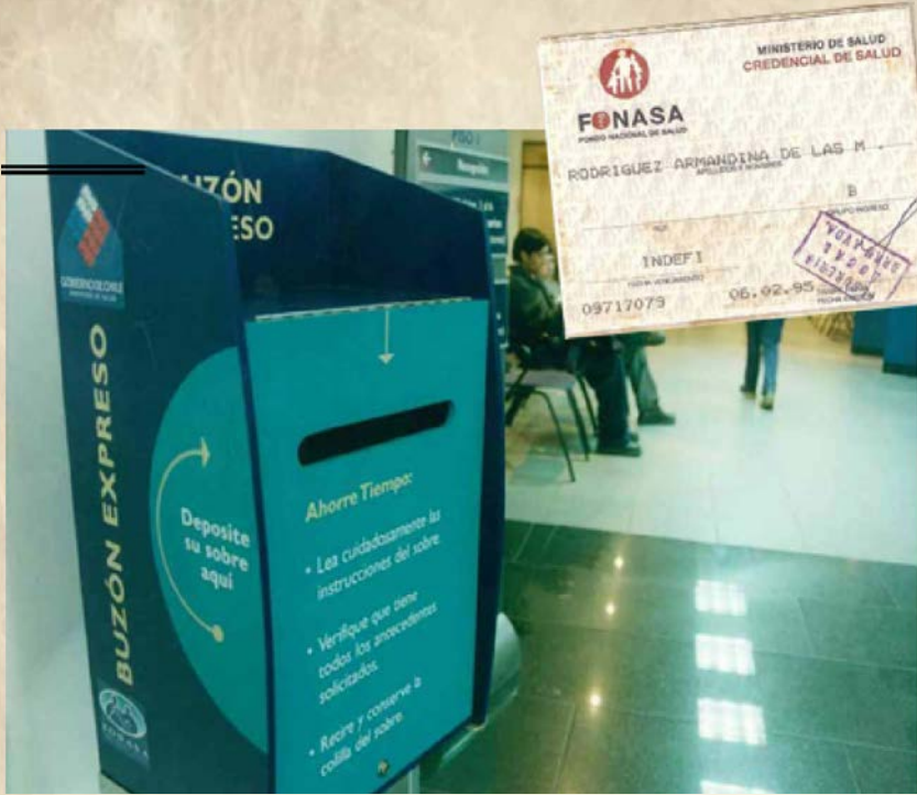
Buzón para recibir las identificaciones de salud desde las empresas para sus trabajadores. Estas credenciales, en 1995, se entregaban después de un mes de solicitadas. El buzón se ubicaba en la sucursal de Moneda 1040, donde antes funcionaba Sermena.