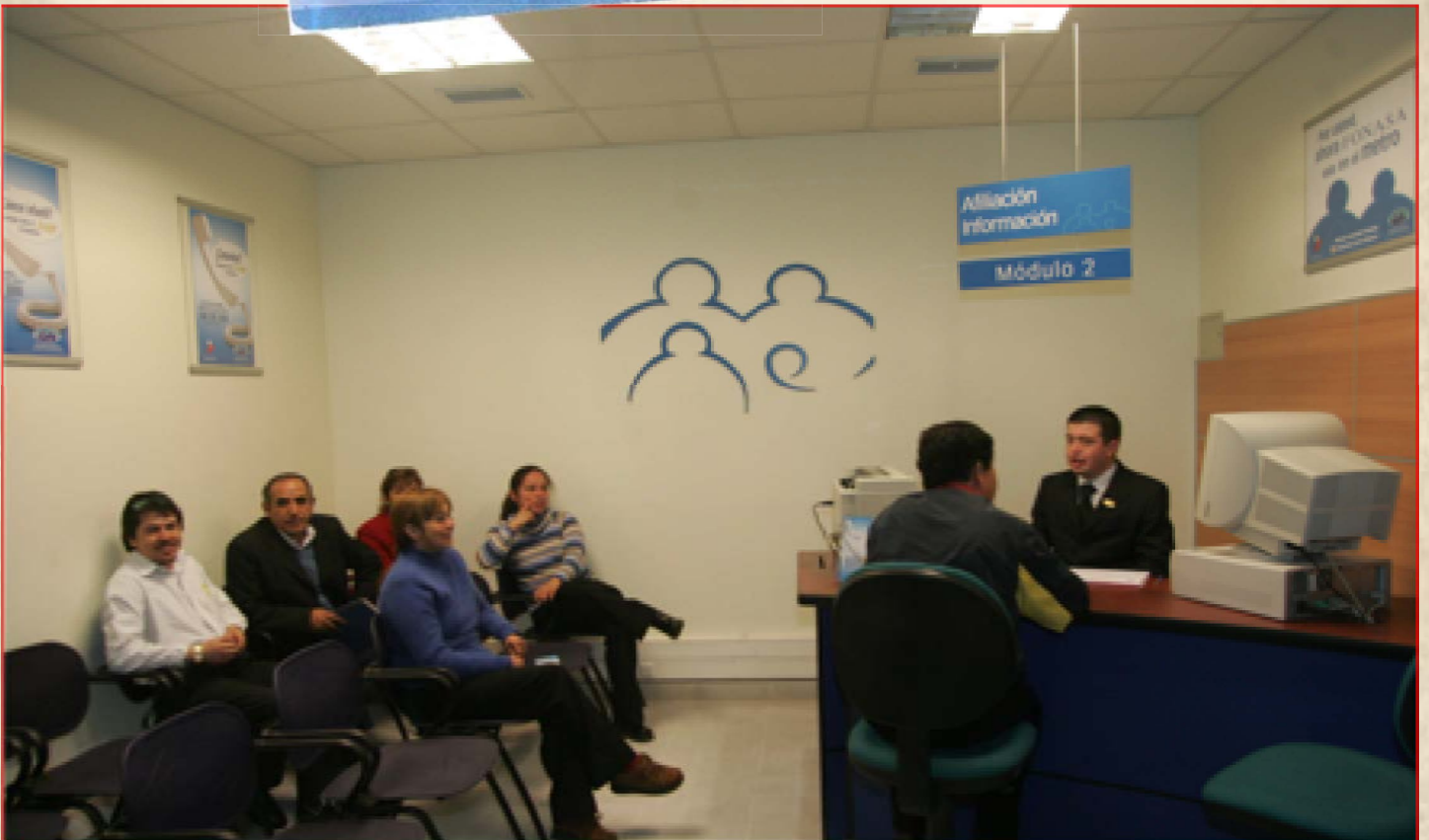
Para estar más cerca de los beneficiarios de Fonasa se inserta una sucursal en el subterráneo del Metro Cerro Blanco, 2012.