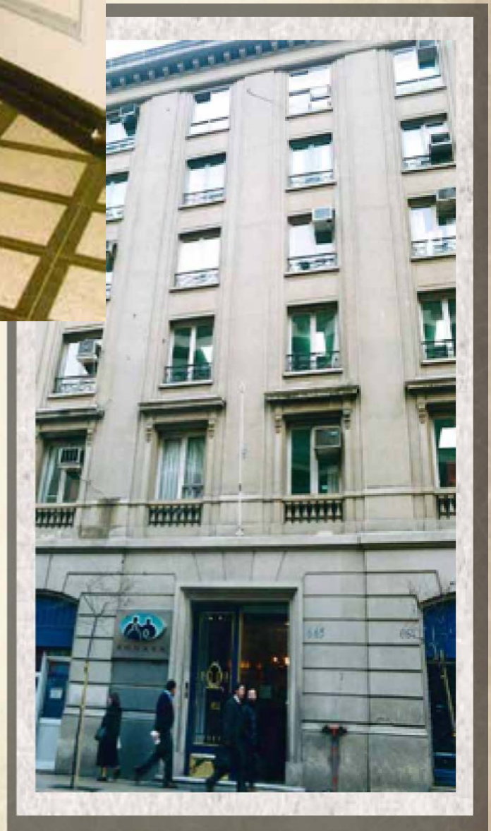
Casa central de Fonasa, donde se encuentran las oficinas administrativas y las principales autoridades. Se ubica, desde 1990, en Monjitas N° 665.