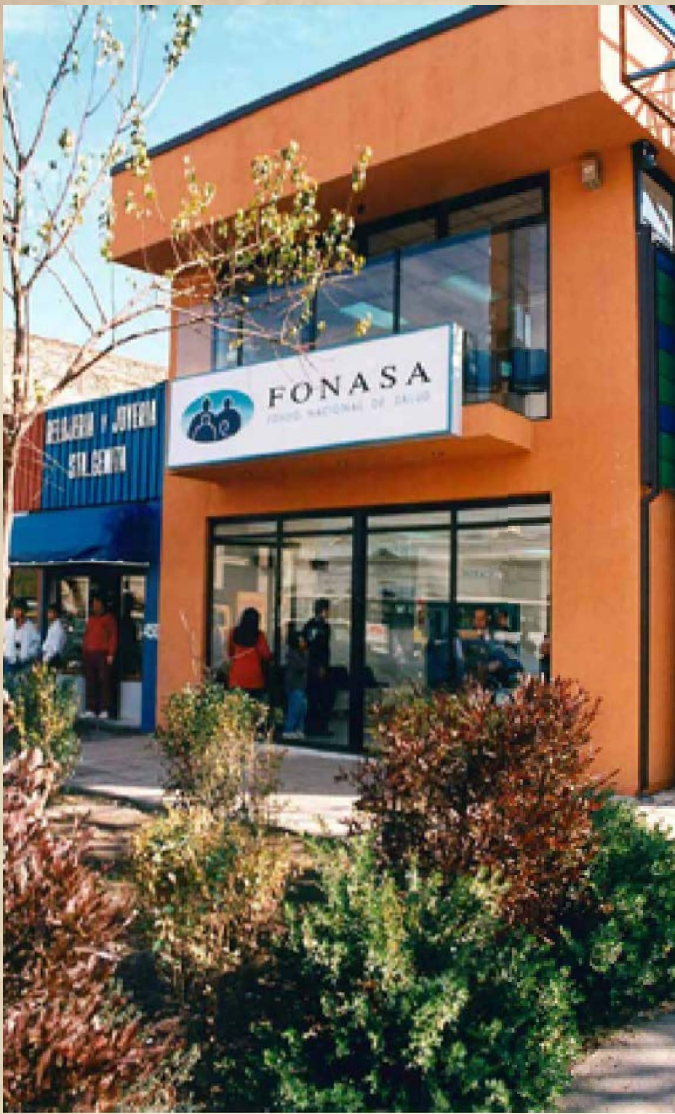
Sucursal de Recoleta, ubicada a un costado de la Clínica Dávila, 1995.