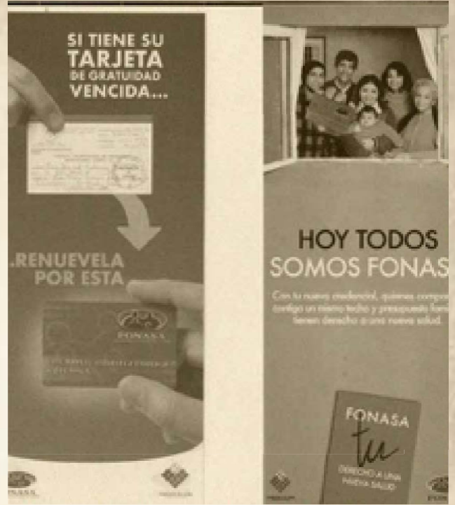
Campaña para cambio de Credenciales de Salud desde papel a plástico.