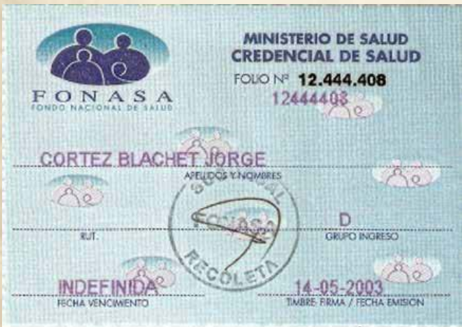
En 2003 se utilizaba una credencial de papel para identificar al usuario, sus cargas familiares y el tramo correspondiente.