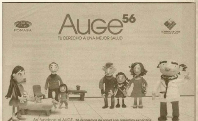
Campaña de Difusión Plan AUGE, 2005. Lanzamiento de las primeras 56 patologías.