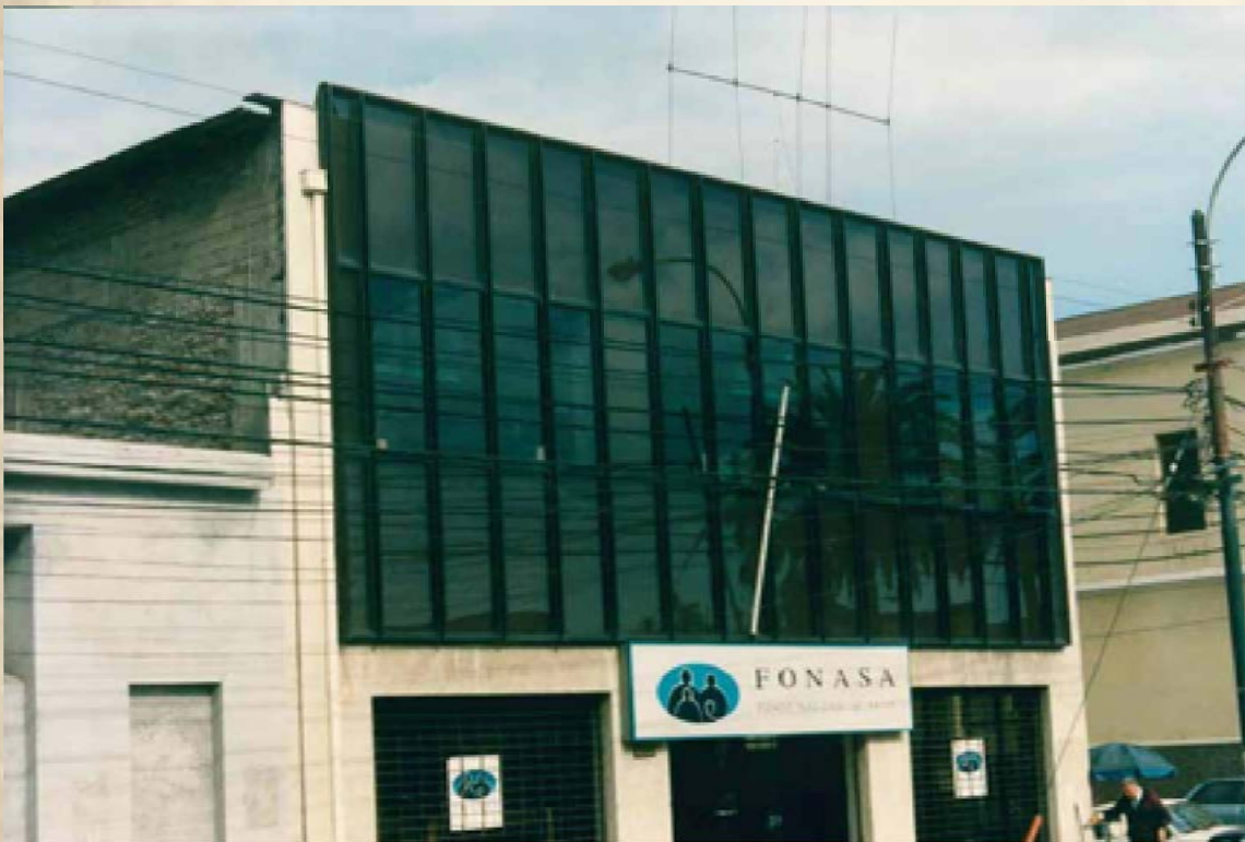
Oficinas Dirección Regional Valparaíso, 1997, cuando las credenciales ya eran plásticas.