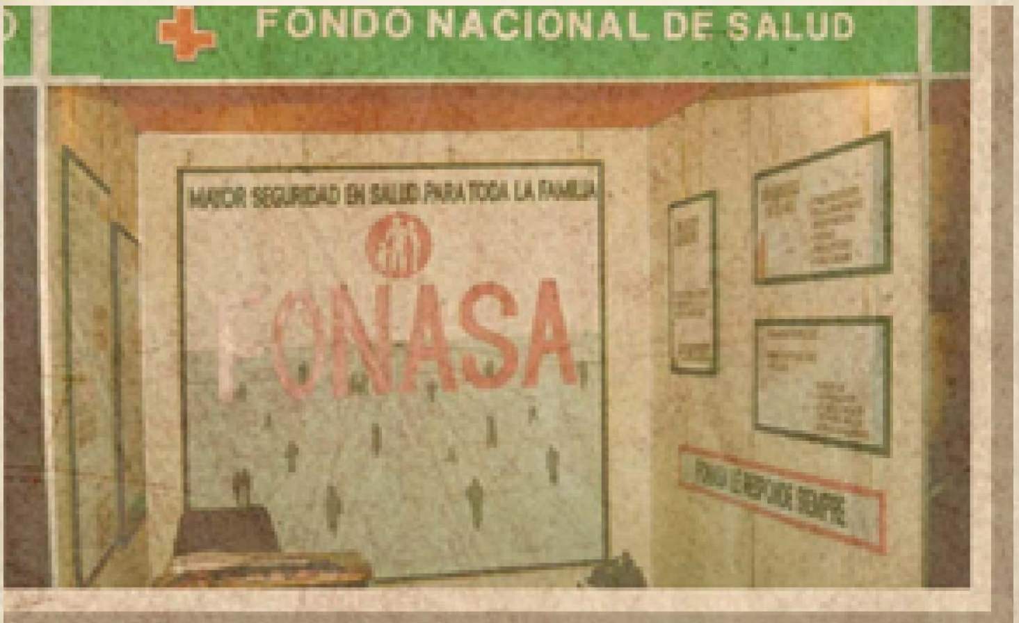
Primeras participaciones en terreno de Fonasa con su Imagen Corporativa, 1996.

La Celebración del Día del Patrimonio Cultural nos convoca a revelar la historia de cuatro décadas del Fondo Nacional de Salud, Fonasa, la que se ha construido con el compromiso, las experiencias y la vocación de servicio de 1.200 funcionarios, de Arica a Punta Arenas.