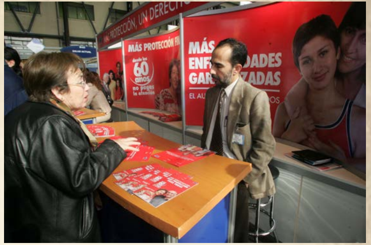
Fonasa en terreno