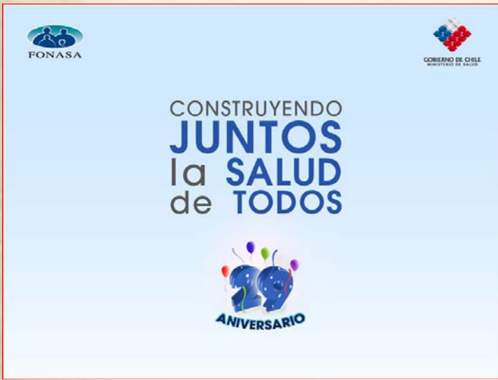
Eslogan 29 años Fonasa