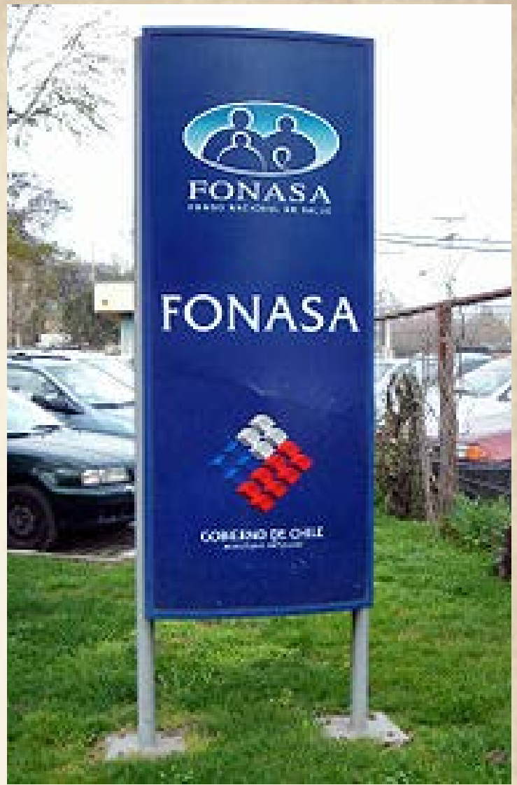
Letrero de Sucursal de Fonasa en Hospital Roberto del Río. Desde 2011 se instalaron sucursales en los recintos hospitalarios.