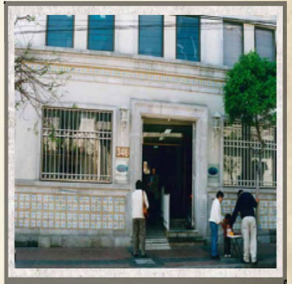
Sucursal La Serena, 2001.