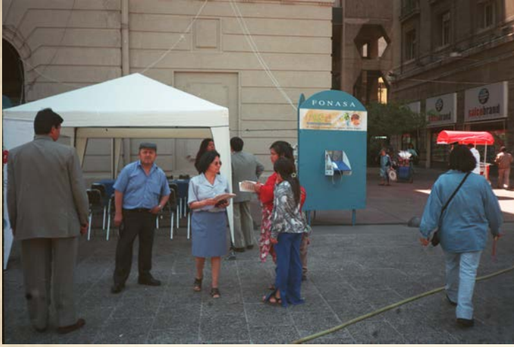
Fonasa en terreno