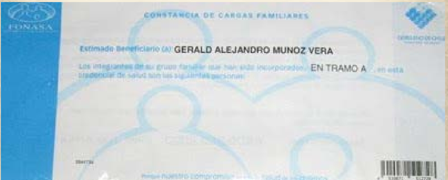
Constancia de Cargas Familiares año 2000