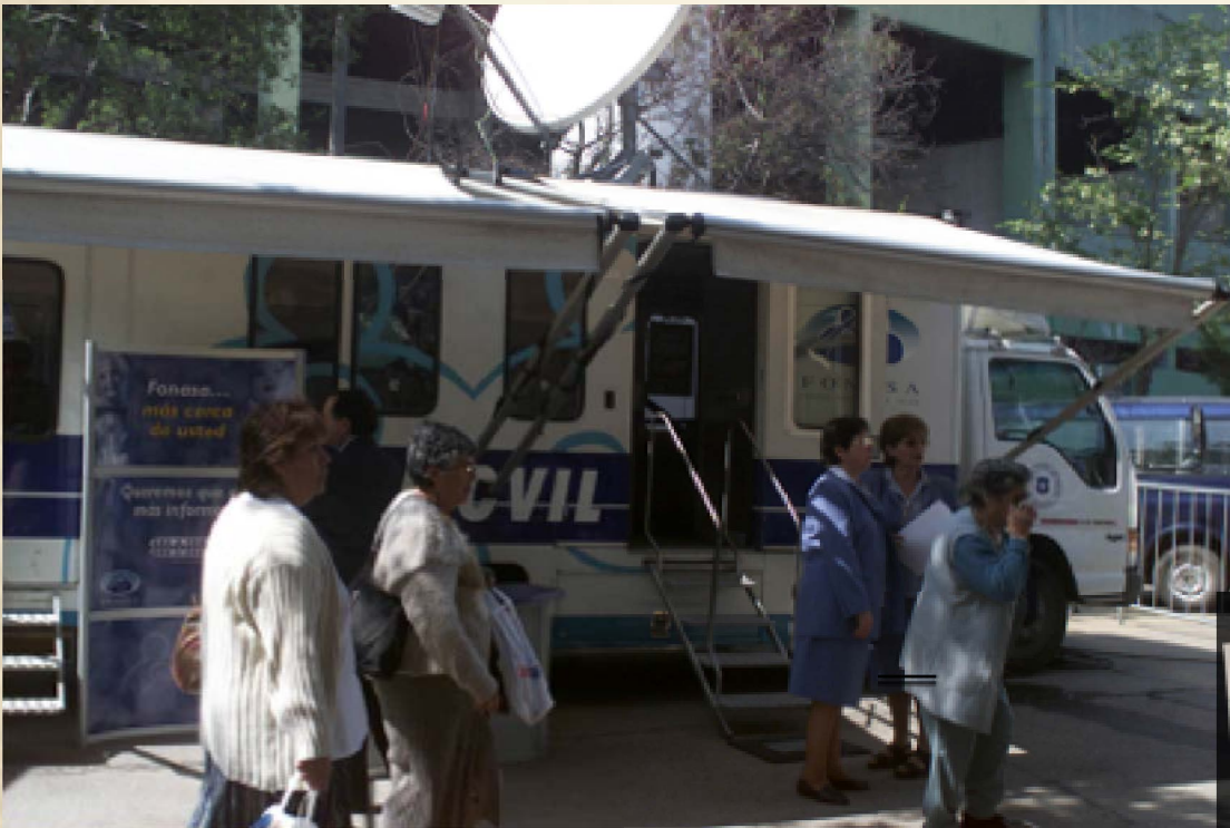
Fonasa está con sus beneficiarios en terreno. Primer Fonasamóvil, 1994.