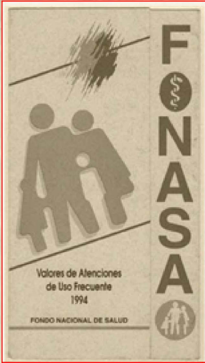
Catálogo Prestaciones, 1994.