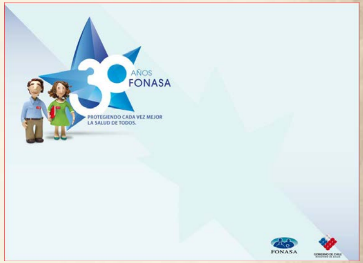
Eslogan 30 años Fonasa