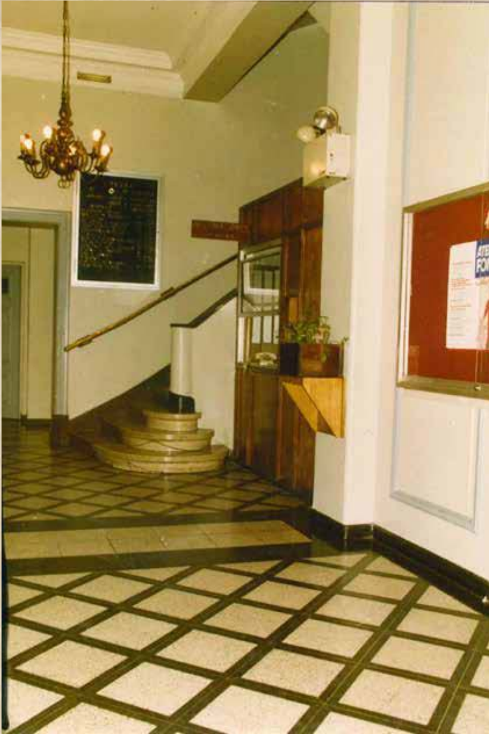
Hall de ingreso a casa central de Fonasa, ubicado en Monjitas 665, en una foto que data de 1990.