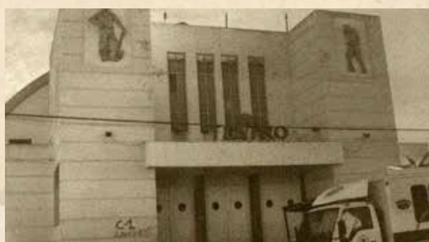
Fotos del Recuerdo FONASA Móvil en el Teatro Salitrera Pedro de Valdivia