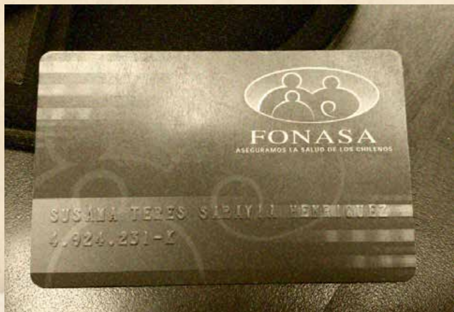
Credencial magnética entregada a partir del año 2005.