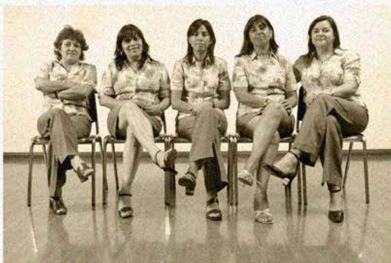
" DÍA INTERNACIONAL DE LA MUJER " 8 DE MARZO 2007