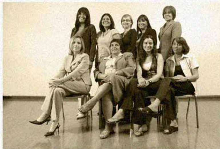
" DÍA INTERNACIONAL DE LA MUJER " 8 DE MARZO 2007

En esta oportunidad rescatamos un set de fotografías correspondientes a la celebración del día de la mujer en el Nivel Central, correspondiente al año 2007, época no muy lejana pero donde podemos advertir algunos interesantes cambios en nuestras compañeras de labores. Esperamos disfruten este interesante hallazgo en nuestro historial fotográfico del Fonasa.