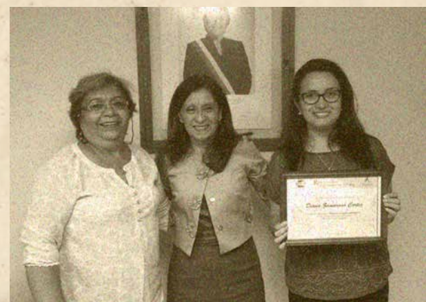
Fotos del Recuerdo Premiadas en el Concurso aniversario Fonasa