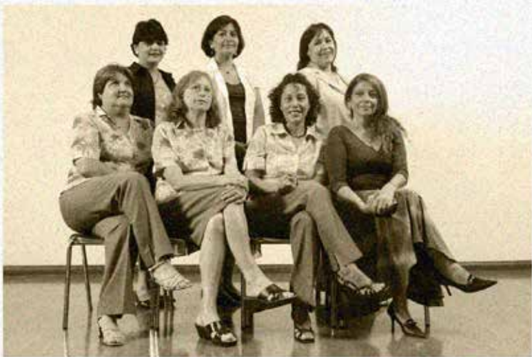
" DÍA INTERNACIONAL DE LA MUJER " 8 DE MARZO 2007