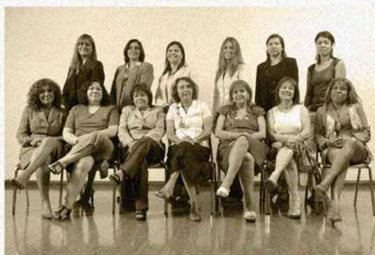
" DÍA INTERNACIONAL DE LA MUJER " 8 DE MARZO 2007