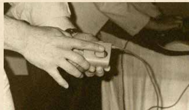
Fotos del Recuerdo Enrolamiento para compra Imed