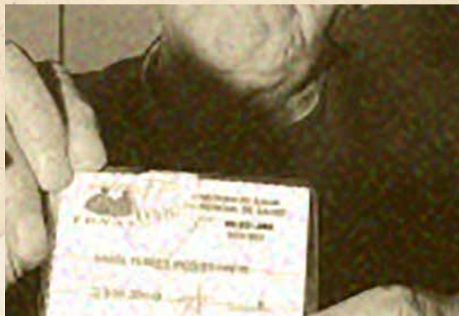
Credencial captada en portal estrellavalpo.cl del año 2008