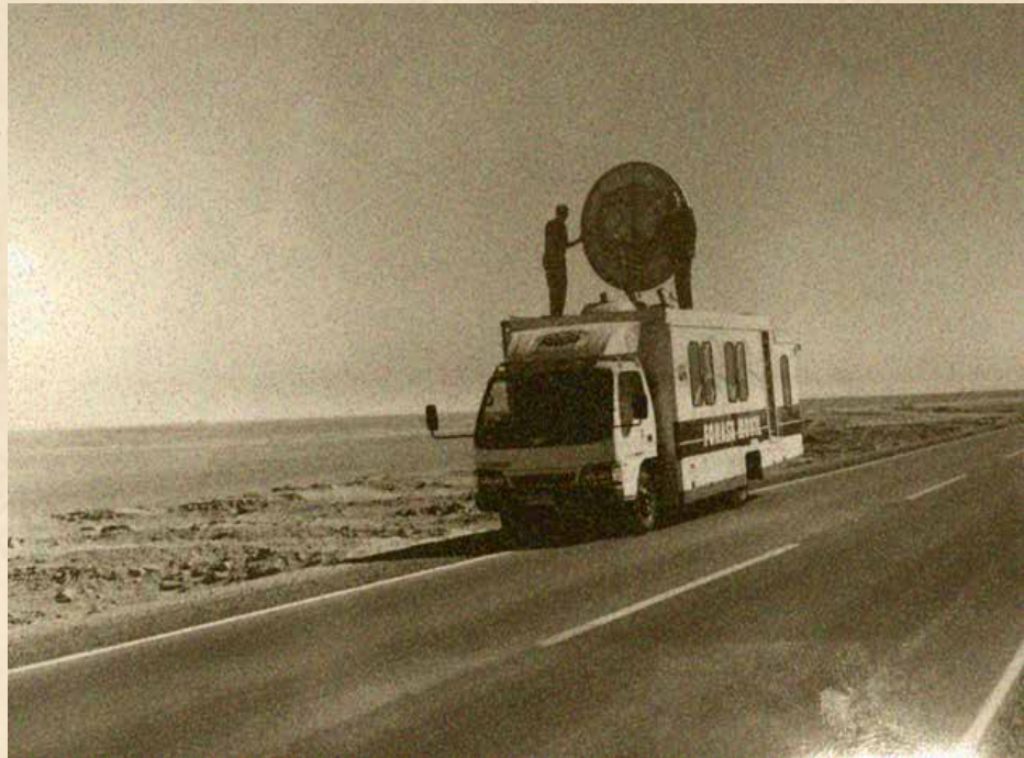
Fotos del Recuerdo FONASA Móvil por el desierto años '90