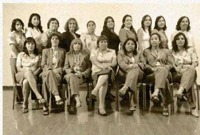
" DÍA INTERNACIONAL DE LA MUJER " 8 DE MARZO 2007