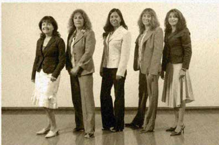
" DÍA INTERNACIONAL DE LA MUJER " 8 DE MARZO 2007