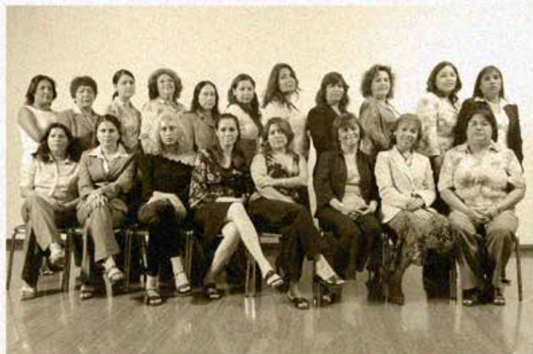
" DÍA INTERNACIONAL DE LA MUJER " 8 DE MARZO 2007